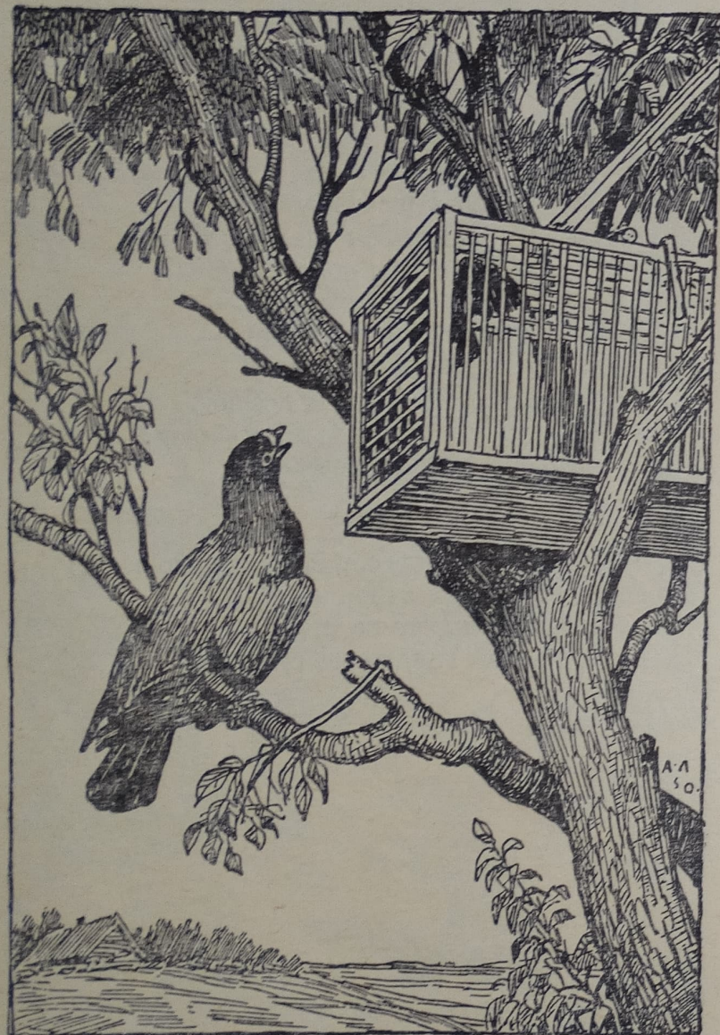
«Чижа захлопнула злодейка-западня».