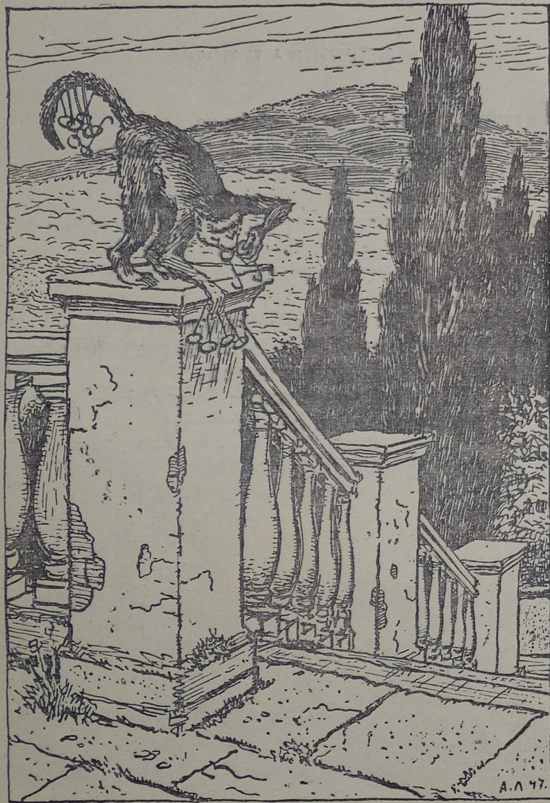
«Вертит очками так и сяк...»