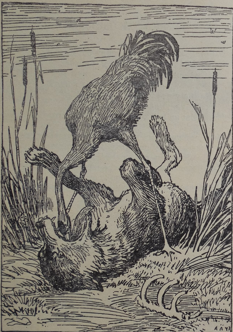
«Журавль свой нос по шею Засунул к Волку в пасть...»