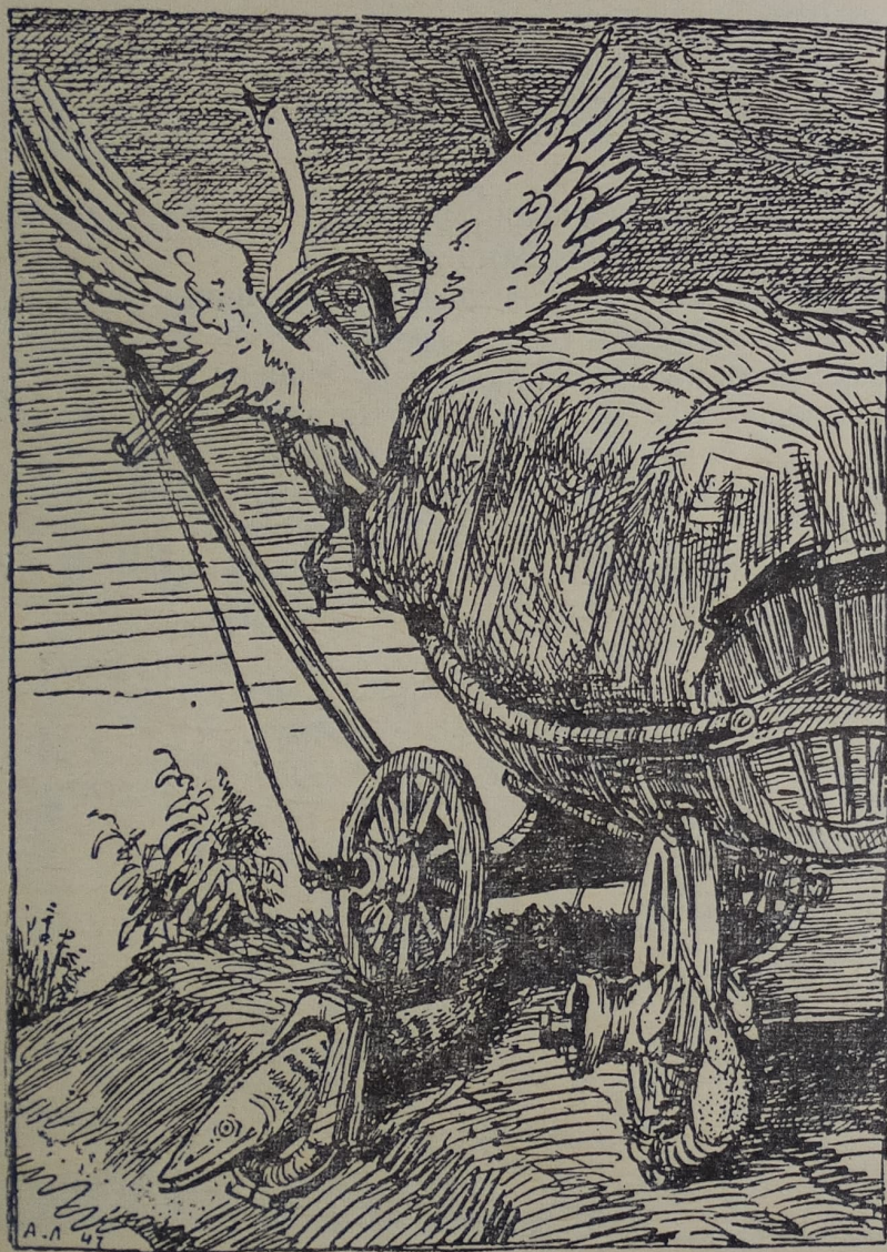
«Да только воз и ныне там».