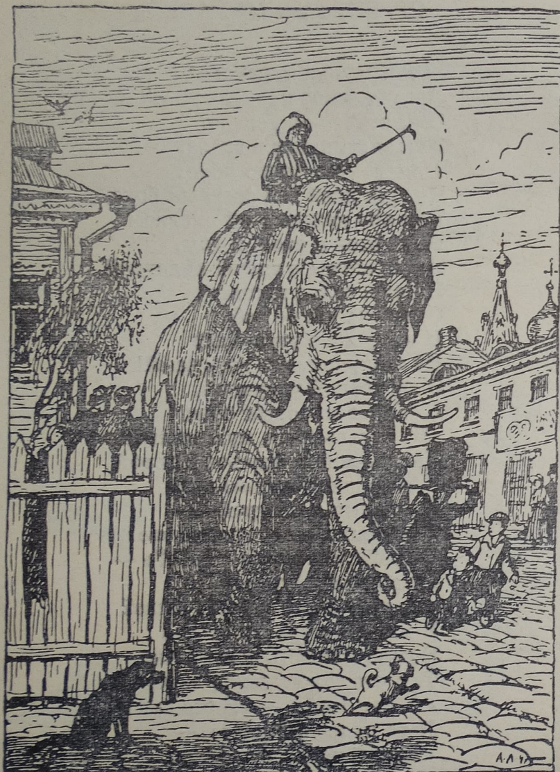
«Отколе ни возьмись, навстречу Моська им...»