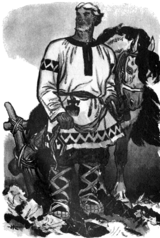
Велит сошку с земельки повыдер-