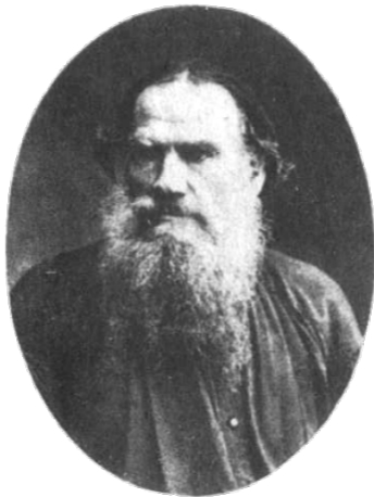
Лев Николаевич Толстой (1828–1910)