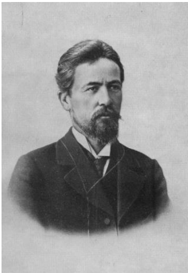
А .П. Чехов. 1899 г. Фотография.