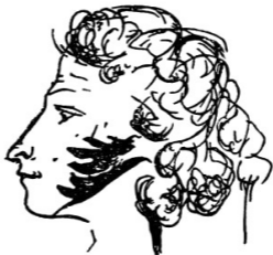
АВТОПОРТРЕТ А. С. ПУШКИНА 1829 г.