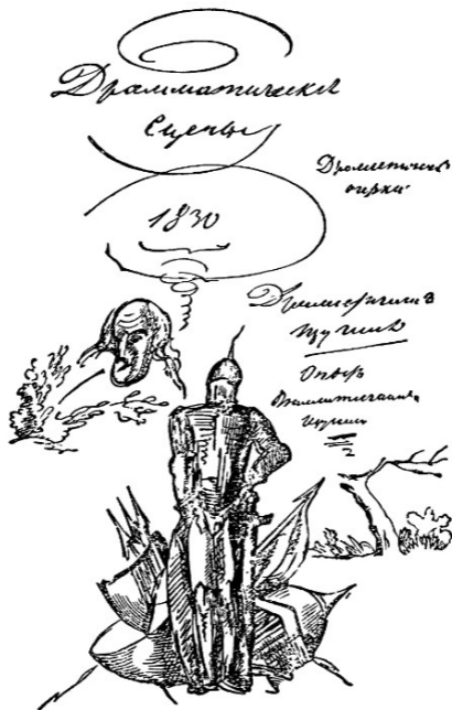
ЗАГЛАВНЫЙ ЛИСТ РУКОПИСИ «ДРАМАТИЧЕСКИЕ СЦЕНЫ». Рисунок А. С. Пушкина. 1830 г.