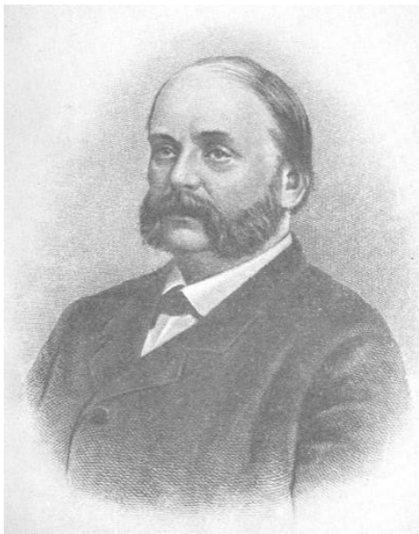
И. А. Гончаров. С гравюры М. Пожалости- на 1883 г.