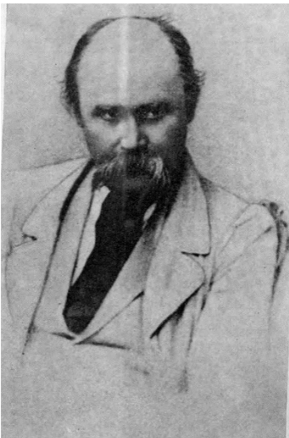
Т. Р. Шаўчэнка. Фота. 1859