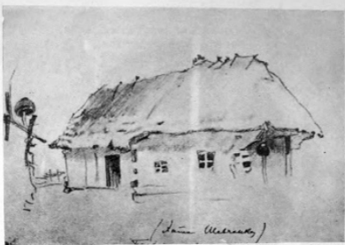
Хата бацькоў. 1843