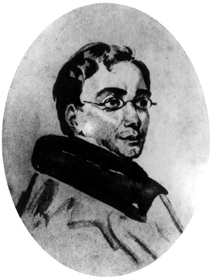
А. С. Грибоедов. Акварель Горюнова. 1820-е гг.