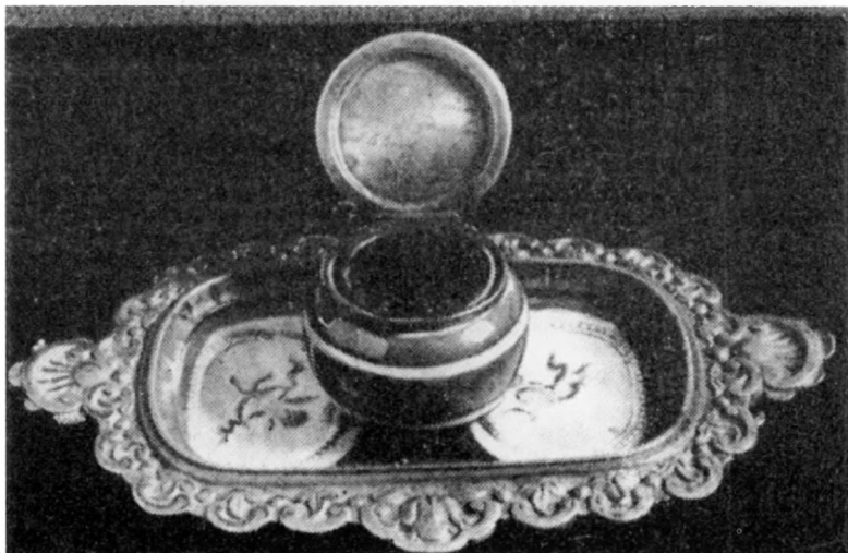
6. Чернильный прибор, подаренный А. С. Грибоедовым жене. На обратной стороне крышки — надпись: «Ecrives me le mien ange Нупаубие! Tout le tien А. <Грибоедов>». (Пиши мне часто, мой ангел Нинобия! Весь твой А. <Грибоедов> (искаж. франц.)) 15 Января 1829 года. Тегеран»