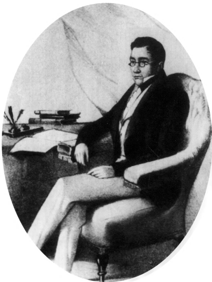
1. А. С. Грибоедов. Литография с рисунка П. А. Каратыгина. 1825 г.