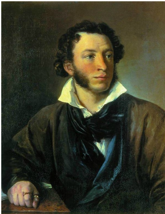
А. С. ПУШКИН Портрет работы художника В. Тропинина. 1827 г.