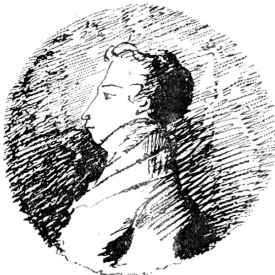
АВТОПОРТРЕТ А. С. ПУШКИНА 1820-1821 гг.