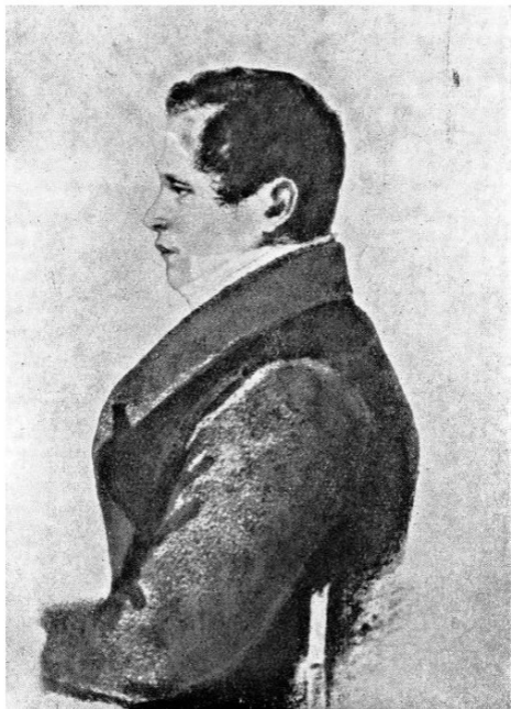
И. И. ПУЩИН. 1798-1859.