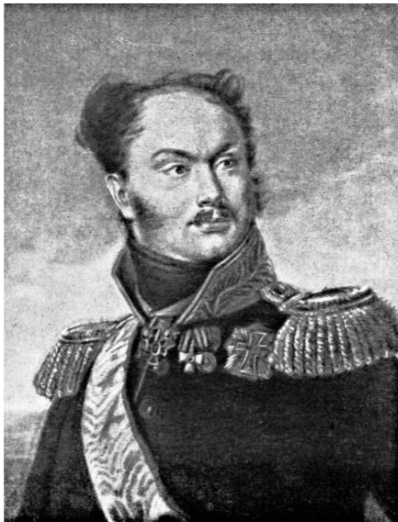
М. Ф. ОРЛОВ. 1788-1842.