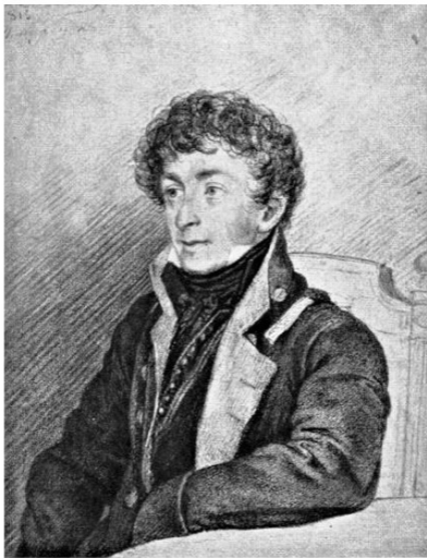
К. Н. БАТЮШКОВ. 1787-1855.

Рисунок художника О. Кипренского. 1815 г.