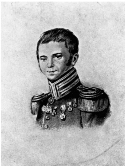
Ф. Н. ГЛИНКА. 1786-1880.

Литография с рисунка неизвестного художника.