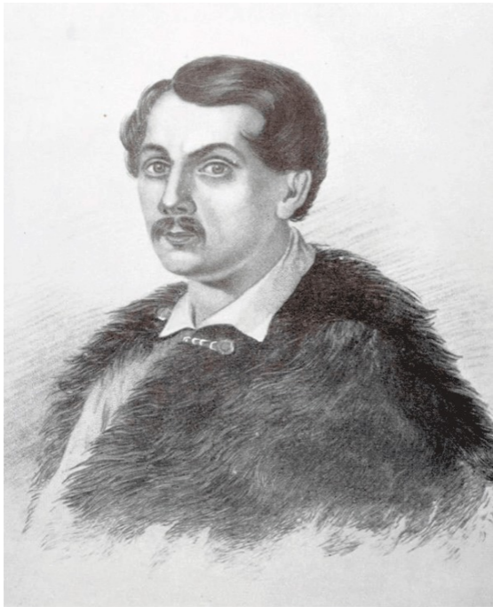
А. А. Бестужев. 1797 - 1837.