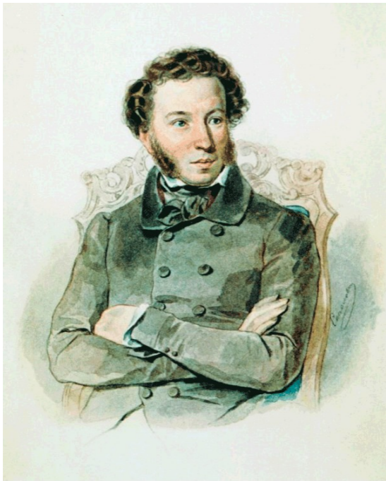
А. С. ПУШКИН Акварель художника П. Соколова. 1830 г.