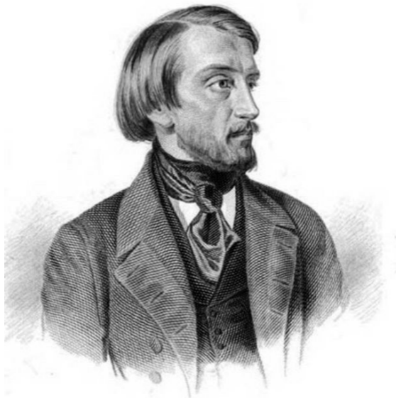
В. Г. БЕЛИНСКИЙ. 1811 - 1848.