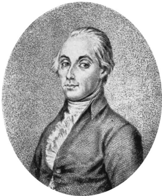
А. Н. РАДИЩЕВ. 1749 - 1802. Гравюра И. Вендрамини.