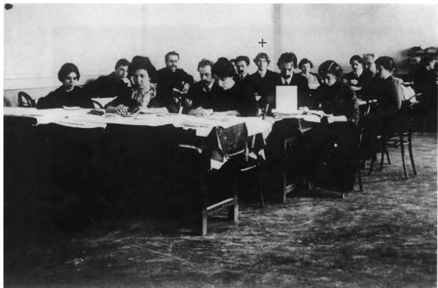
13. С. А. Есенин в группе работников типографии «Т-во И. Д. Сытина» 1914. Москва.