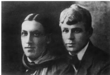
38. С. А. Есенин, А. Б. Мариенгоф. 1919, лето. Москва.