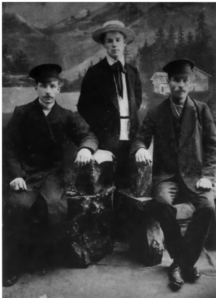
8. С. А. Есенин. 1913.