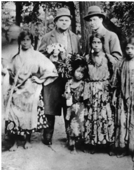
100. С. А. Есенин с сестрой Екатериной. 1925. Москва. На Пречистенском бульваре.