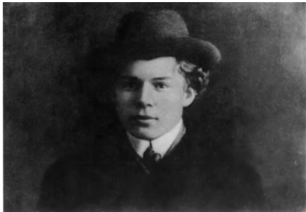
10. С. А. Есенин. 1914, январь.