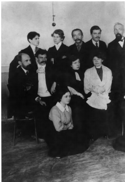
14. С. А. Есенин с друзьями юности. 1914. Москва.