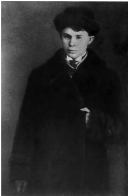
7. С. А. Есенин с отцом А. Н. Есениным и дядей И. Н. Есениным. 1913, июль, 13. Москва.