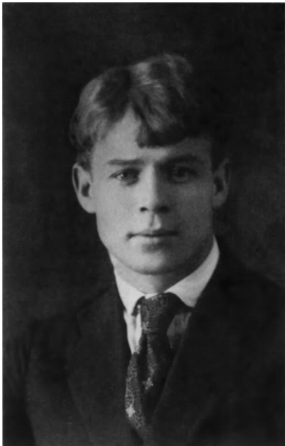
58. С. А. Есенин. 1922.