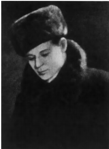
59. С. А. Есенин, Ирма Дункан, Айседора Дункан. 1922, май, 2. Москва.