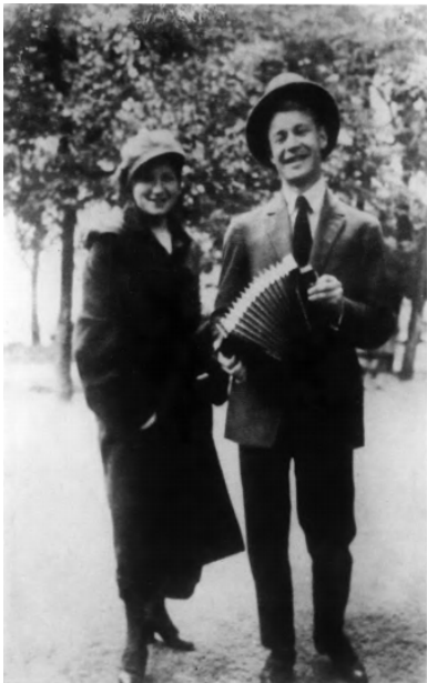
101. С. А. Есенин. 1925. Москва.