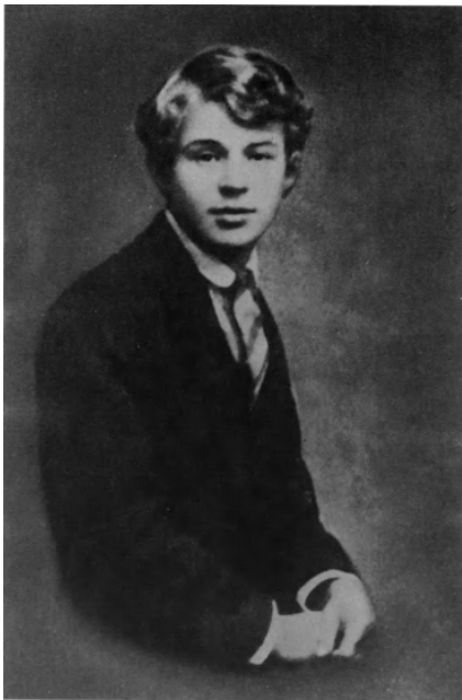
9. С. А. Есенин. 1913 (?).