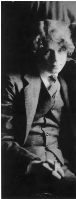
21. С. А. Есенин, Н. А. Клюев. 1916.