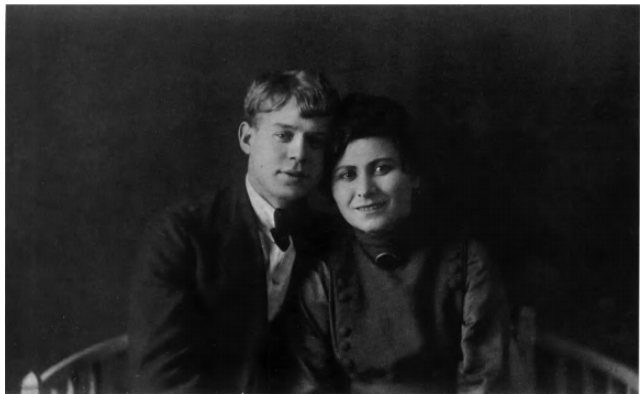
57. С. А. Есенин. 1921 — начало 1922.