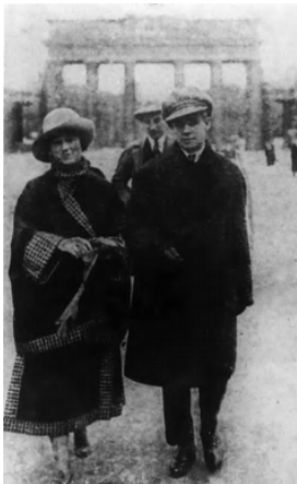
65. С. А. Есенин, Айседора Дункан. 1922. Берлин.