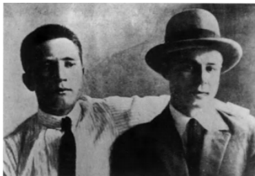
97. С. А. Есенин, В. Ф. Наседкин. 1925. Москва.