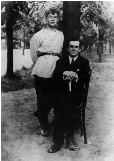
34. С. А. Есенин. 1919. Москва.