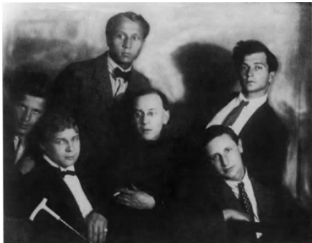
79. С. А. Есенин. 1924, апрель. Ленинград.