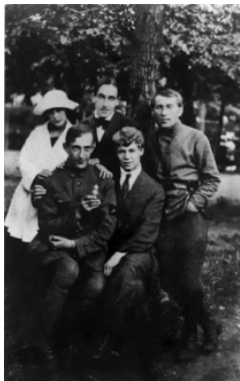
49. С. А. Есенин, В. Г. Шершеневич,