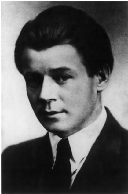
102. С. А. Есенин. 1925. Москва.