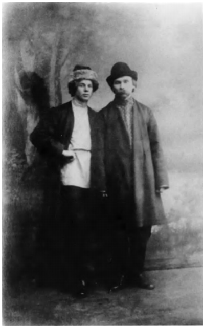
22. С. А. Есенин. 1916. Петроград.