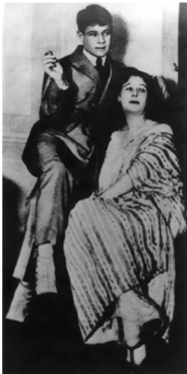
73. С. А. Есенин, Айседора Дункан. 1922, октябрь. Америка.