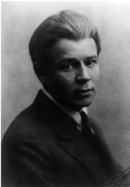
103. С. А. Есенин. 1925. Москва.