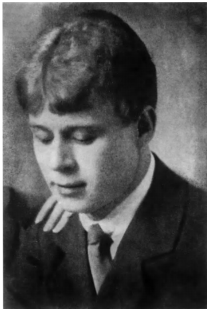
61. С. А. Есенин, Айседора Дункан. 1922.