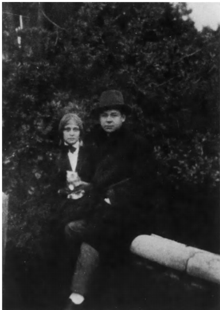
91. С. А. Есенин в группе неизвестных лиц. 1925, январь, Батум.