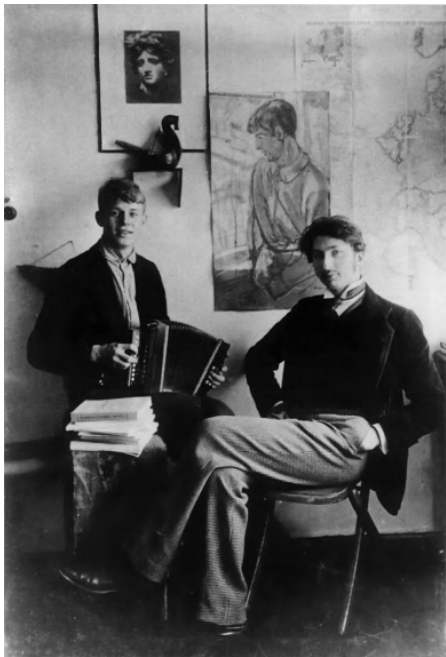
20. С. А. Есенин. 1915.