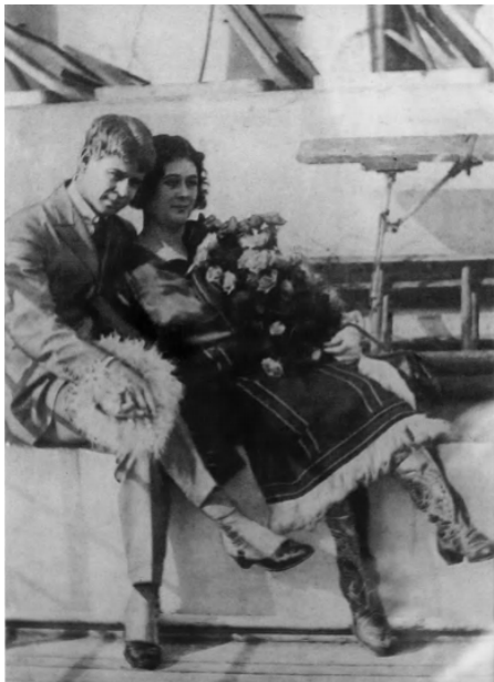
по прибытии в Нью-Йорк. 1922, ок- тябрь, 1. 72. С. А. Есенин, Айседора Дункан. 1922, октябрь, 1. Нью-Йорк.