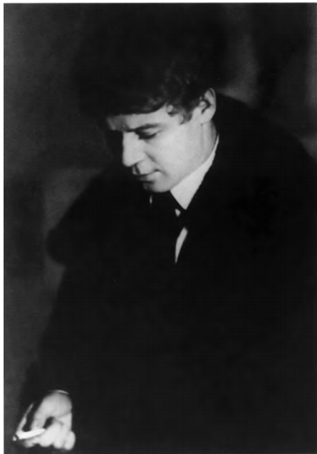
80. С. А. Есенин. 1924, апрель. Ленинград.