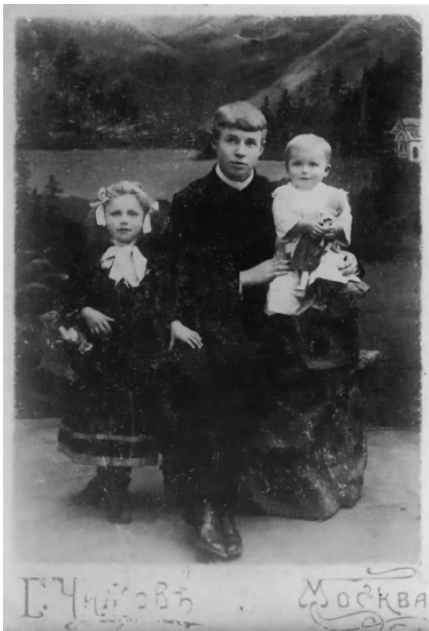
6. С. А. Есенин. 1913. Москва.