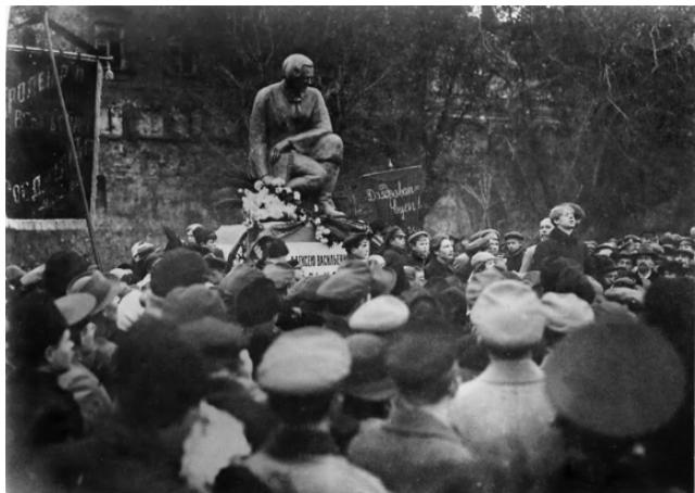
32. С. А. Есенин на открытии памятника А. В. Кольцову. 1918, ноябрь, 3. Москва. Кадр кинохроники.