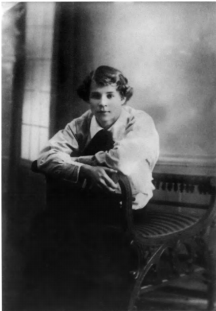
11. С. А. Есенин. 1914. Москва.