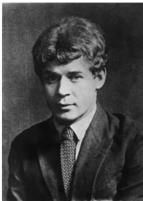
74 С. А. Есенин. 1923. Париж. 75. С. А. Есенин. 1923.