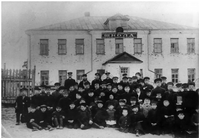
4. С. А. Есенин. 1912.