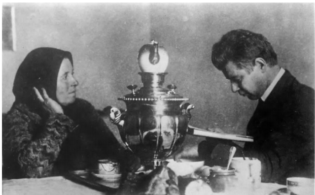
92. С. А. Есенин с матерью Т. Ф. Есе-