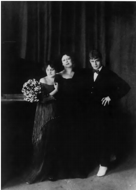
60. С. А. Есенин. 1922. Москва.