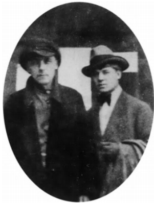
46. С. А. Есенин, А. Б. Мариенгоф, В. В. Хлебников. 1920, апрель. Харьков.