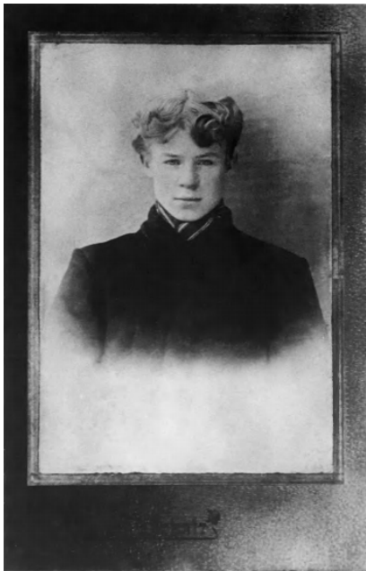
5. С. А. Есенин с сестрами Катей и Шурой. 1912. Москва.