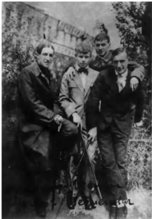
Б. Кусиков, В. Г. Шершеневич. 1919, лето (?). Москва.