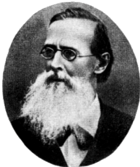
Аполлон Николаевич Майков (1821–1897)