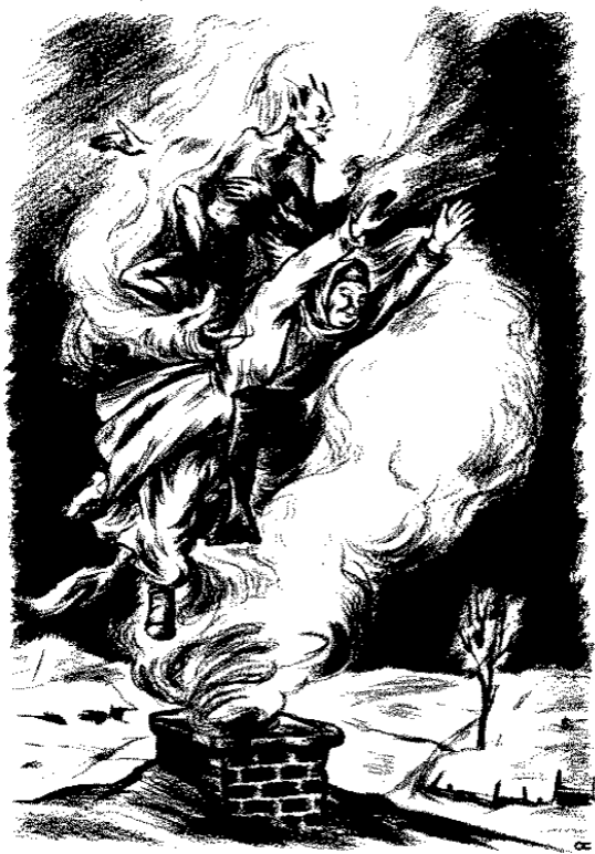
Чорт отправился всад за Солохой...