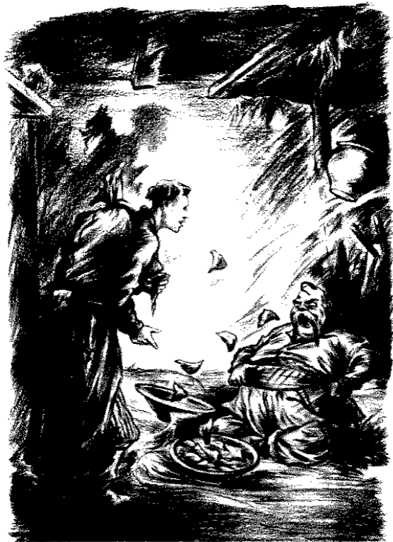
Вареник выплеснулся из миски, пленнулся в сметану и подскочил вверх...