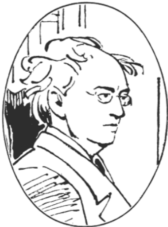
Фёдор Иванович Тютчев (1803–1873)