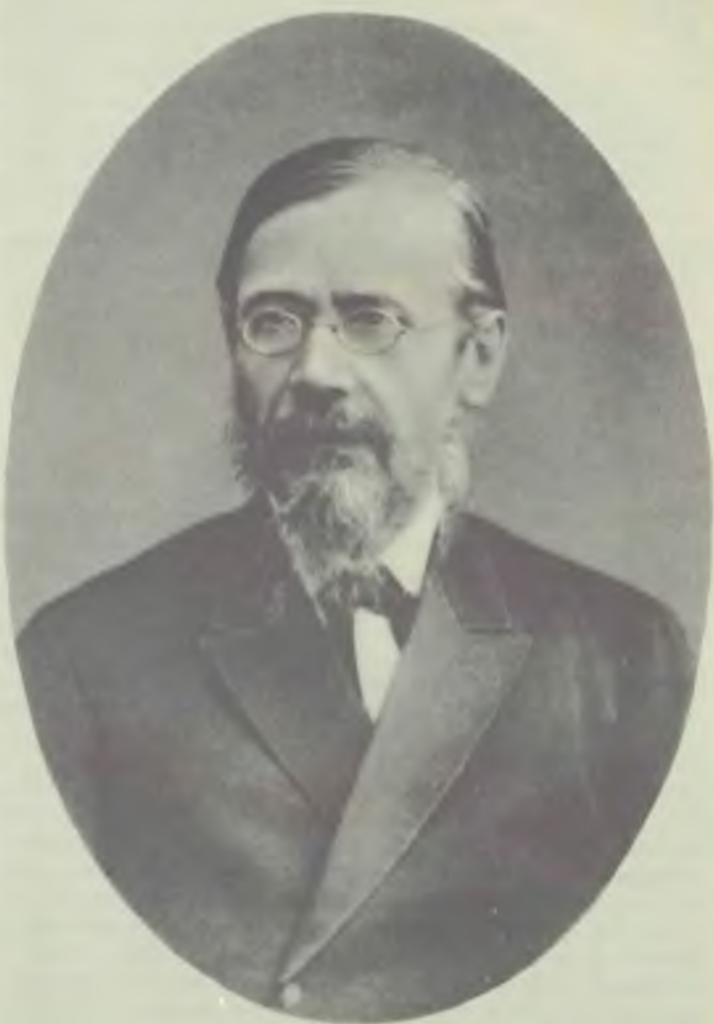
Василий Осипович КЛЮЧЕВСКИЙ 1895